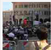
Via al Festival della Filosofia nel